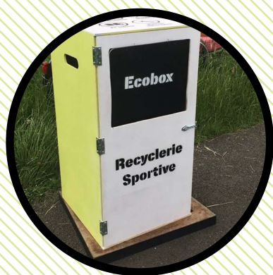
Collecte de matériel sportif

La Recyclerie Sportive est une association à l'échelle nationale qui collecte, valorise, redistribue et sensibilise au Sport Zéro Déchet par le réemploi et la réutilisation de matériel sportif.