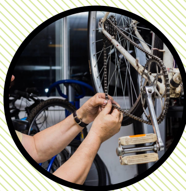
Atelier de co-réparation