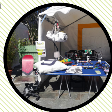
Actions de sensibilisation